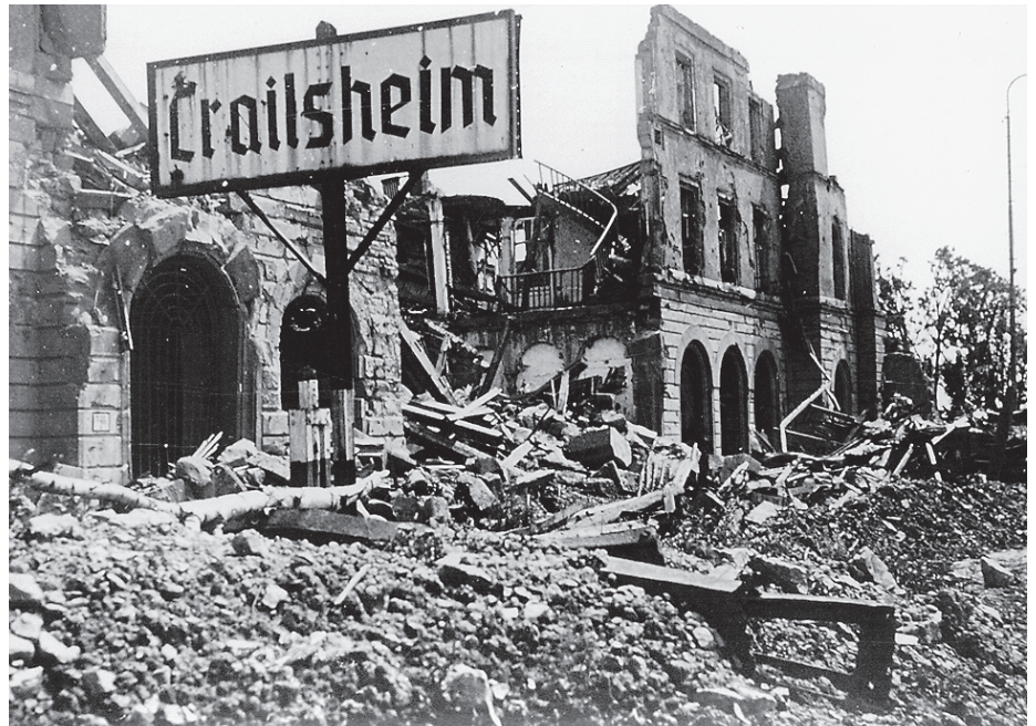
Auch der Crailsheimer Bahnhof wurde nahezu komplett zerstört.

Die „Sonderrolle“ Crailsheims begann am 5./6. April 1945, als motorisierte Einheiten der US-Armee die starken deutschen Verteidigungsstellungen an Neckar und Jagst bei Heilbronn umgingen und in schnellem Tempo entlang der