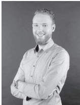
Dozent Henrik Abel

Ein ganztägiger Aufbaukurs am Samstag, 13. Mai, an der vhs richtet sich an alle, die Photo-shop im Rahmen von Fotografie, Druck oder im Webbereich nutzen wollen. Die Teilnehmer erfahren, wie auch spektakuläre Bildeffekte problemlos gelingen.