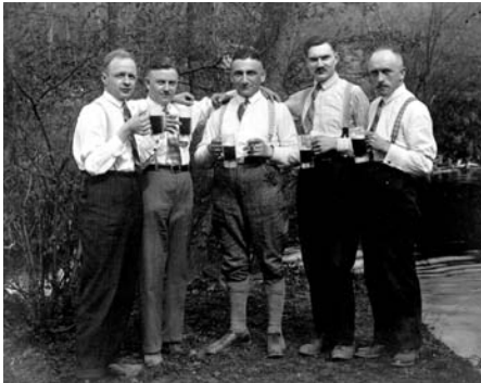
Biertrinkende Männerrunde (um 1900) - es geht auch anders

R 10021 Zeit für Männer. Männerrunde am Abend