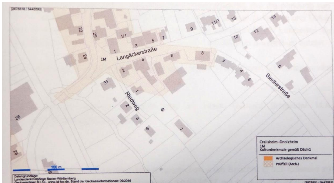
Abbildung 1: Lage des archäologischen Relevanzbereichs in Onolzheim

Der Abgrenzungsbereich befindet sich in der archäologischen Verdachtsfläche „Mittelalterlicher und neuzeitlicher Bereich Onolzheim“, deren Abgrenzungsbereich in untenstehender Karte ersichtlich ist.