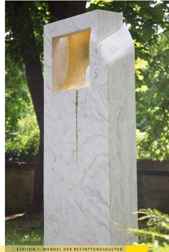
STATION 7: WANDEL DER BESTATTUNGSKULTUR