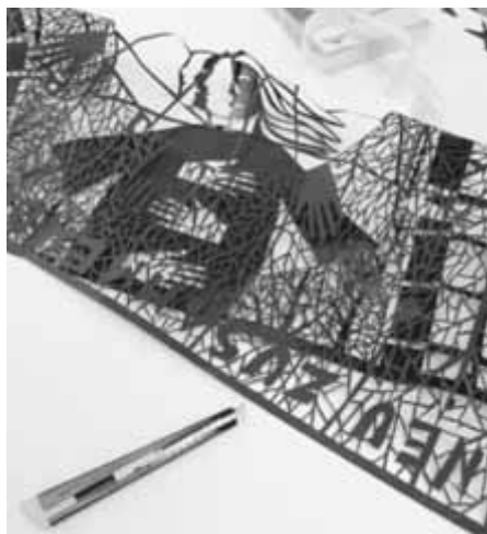
Der Arbeitstisch von Künstlerin Ingrid Eberspächer.

Anmeldungen zum Workshop bis 24. Mai erbeten unter Tel. 403-3720 oder friederike.lindner@crailsheim.de. Bitte eine Nagelschere mitbringen.