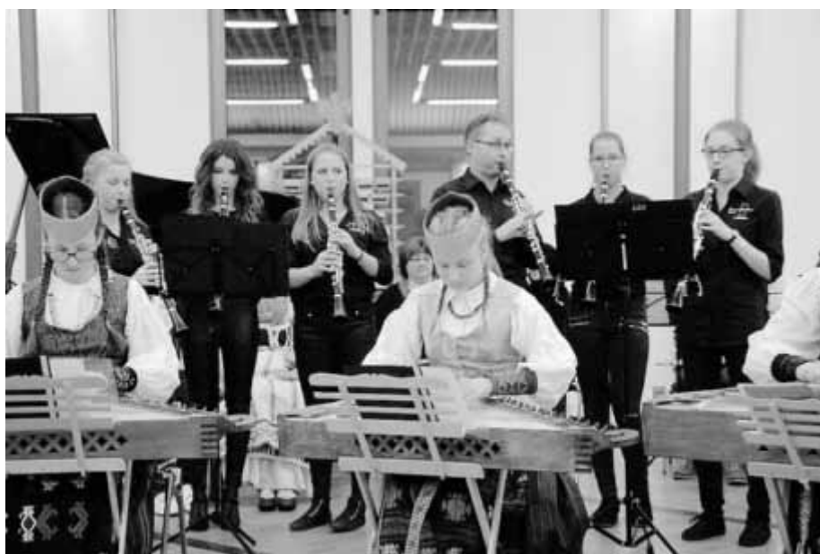
Musik verbindet die beiden Partnerstädte Crailsheim und Jurbarkas von Anfang an.

Die litauischen Gäste und die Crailsheimer Musikschüler werden wieder gemeinsam proben und ein Konzert im Ratssaal vorbereiten. Die litauischen Musiker geben außerdem ein Konzert auf Schloss Stetten. Natürlich werden die Gäste auch verschiedene Ausflüge machen. So stehen unter anderem der Freizeitpark in Geiselwind und Rothenburg auf dem Programm. pm