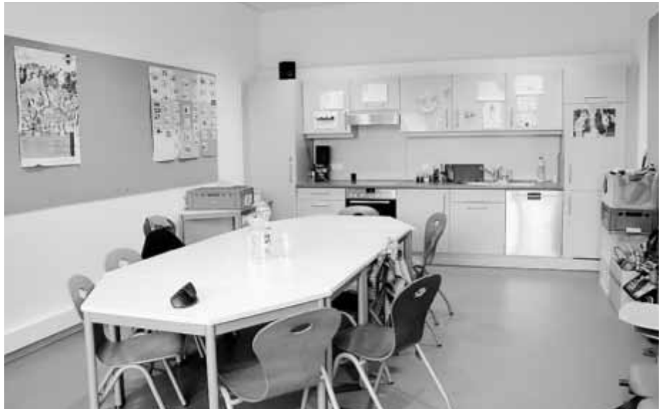
Die Jugendräume in Hirtenwiesen sind ein Ort für gemeinschaftliche und selbstbestimmte Freizeitgestaltung.

Dabei ist aber nicht das Freizeitangebot wie Kochen, Backen oder Basteln ausschlaggebend, sondern die offenen Räumlichkeiten an sich, die eine Möglichkeit für Gemeinschaft außerhalb der Schulzeiten bieten. Die Zahl der Jugendlichen, die regelmäßig den offenen Treff besuchen, ist über die letzten 1,5 Jahre gestiegen. Die Räume mit Sofas, Küchenzeile, Kicker, Dart, Gesellschaftsspielen und die Außenfläche bieten den Jugendlichen, die sich untereinander zum größ-