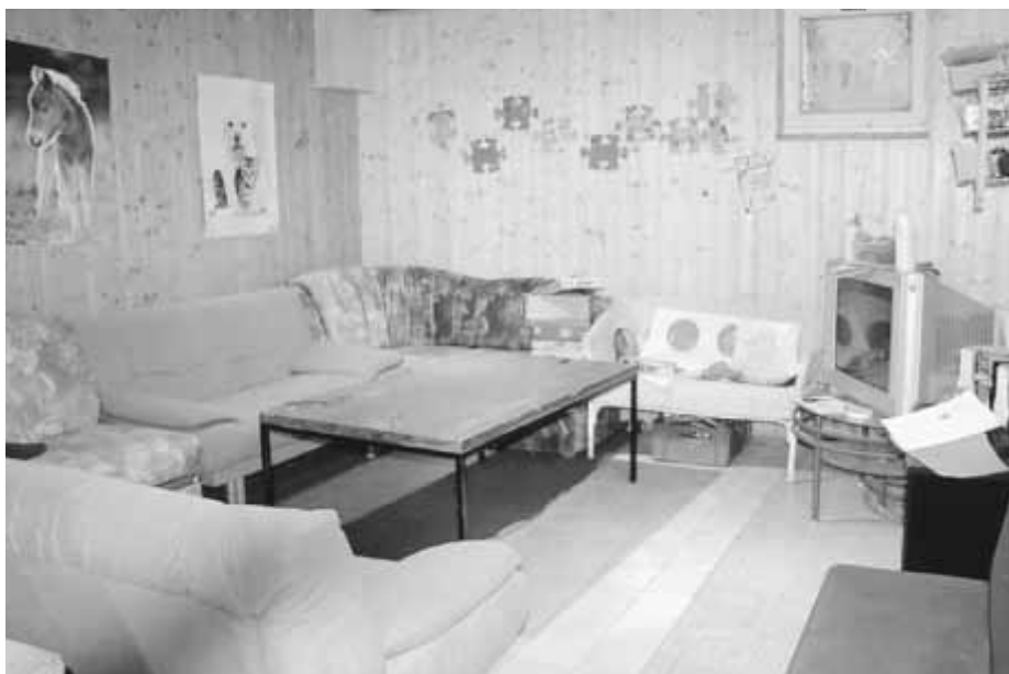
Der offene Kinder- und Jugendtreff in Roßfeld.