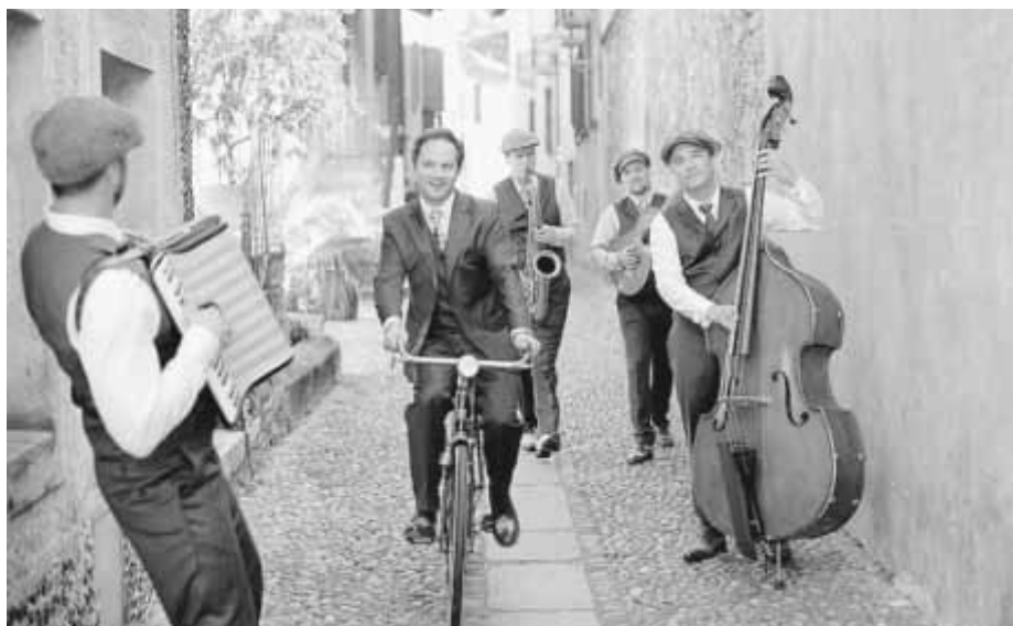
Mit ihnen beginnt das diesjährige KUWO: Am Donnerstag, 20. Juli treten die „Don & Giovannis“ im Spitalpark auf.

Don & Giovannis machen sich die berühmtesten Opernmelodien zu eigen, indem sie sie in populäre und nostalgische Lieder verwandeln und sich dabei