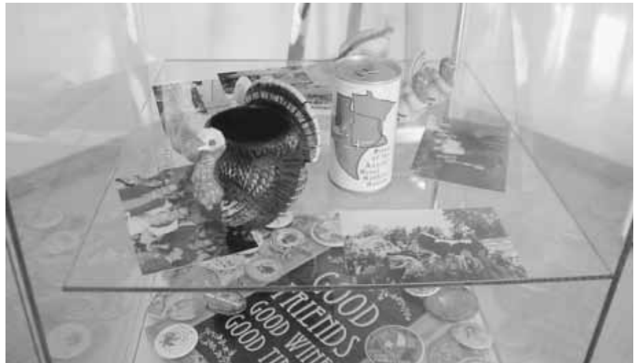
In der Präsentation zu sehen: Erinnerungsstücke rund um den „turkey“.

Verlängert und noch bis einschließlich Sonntag, 15. September zu sehen, ist die Präsentation zu der seit 70 Jahren bestehenden Städtepartnerschaft Worthington - Crailsheim im Stadtmuseum im Spital. Zahlreiche Crailsheimer GastgeberInnen, AustauschschülerInnen, TeilnehmerInnen der Städtepartnerschaftsrei-