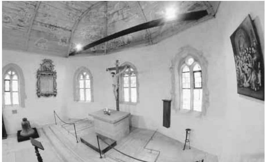
Am Tag des Denkmals ist auch die Gottesackerkapelle auf dem Ehrenfriedhof von 11.00 bis 17.00 Uhr zu besichtigen.

Ein weiteres Highlight wird eine Führung mit Pfarrer Uwe Langsam auf den Glockenturm und den Dachstuhl der Johanneskirche sein. Beginn ist um 13.00 Uhr. In ihrem 150. Jubiläumsjahr ist natürlich auch die Eisenbahn in Crailsheim wieder vertreten: Von 11.00 bis 17.00 Uhr lädt die gemeinnützige Bahnbetriebswerk Crailsheim AG auf das Gelände unterhalb des Wasserturms ein. Bei Führungen gibt es Informationen über die noch vorhandenen Gebäude des ehemaligen Bahnbetriebswerks und die weiteren Planungen zur Wiederherstellung bzw. Weiterentwicklung der dortigen Infrastruktur.