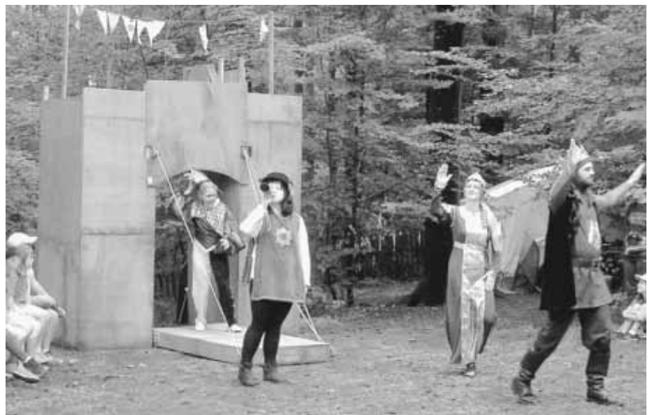
Stadtranderholung im Mittelalter: Täglich luden der König und seine Schwester zur Burgversammlung ein.