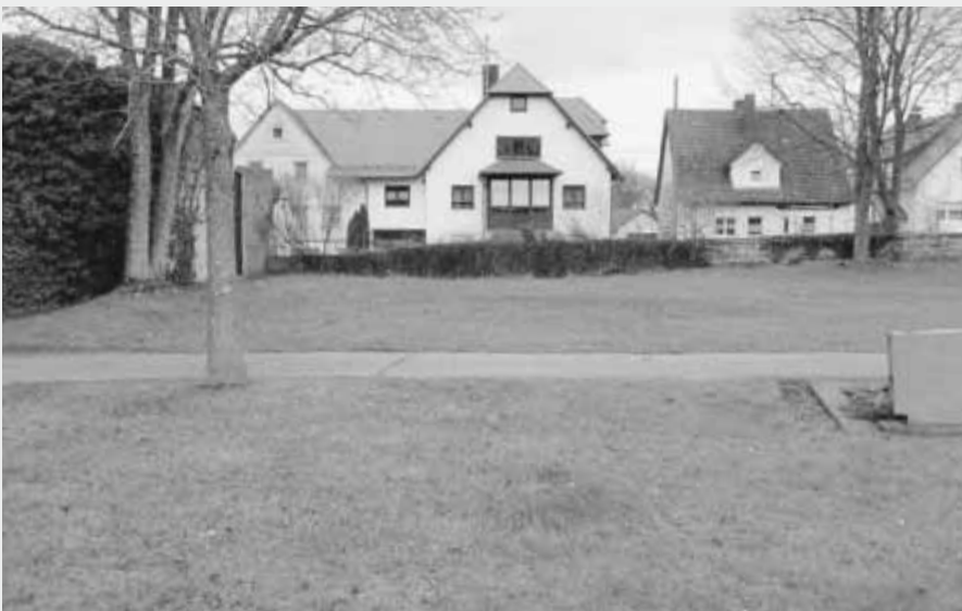
Der Friedhof in Jagstheim wird erweitert.

kostenlos von der Bundesgartenschau Heilbronn 2019 GmbH zur Verfügung gestellt und bleibt nach der BUGA in Crailsheim. Unter dem Hashtag #bugazwerg werden alle Bilder, die über einen öffentlichen Twitter- oder Instagram-Account veröffentlicht werden, auf der „Social-Wall“ der Bundesgartenschau gesammelt: https://www.buga2019.de/de/bundesgartenschau/buga-zwerg.php .