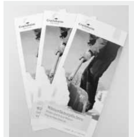
Kostenlos im Bürgerbüro erhältlich ist ab sofort ein Flyer mit dem Titel „Winterdienstpflichten“. Neben generellen Informationen und Tipps zum Winterdienst werden die Räumpflichten für Bewohner erläutert. cl

Zu widerhandlungen gegen die Polizeiverordnung der Stadt Crailsheim über die Verpflichtung der Straßenanlieger zum Reinigen, Schneeräumen und Bestreuen der Gehwege (Streupflicht-Satzung) vom 21.12.1989 sind Ordnungswidrigkeiten und müssen mit empfindlichen Geldbußen geahndet werden. Das Ordnungsamt bittet die Verpflichteten, nicht zuletzt auch um Geldbußen zu vermeiden, diese Vorschriften sorgfältig zu beachten. pm