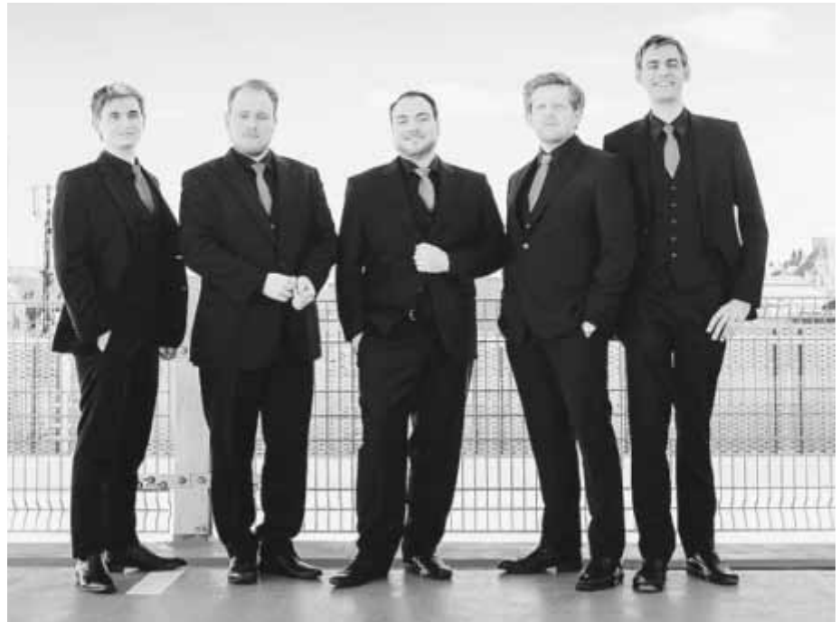
Am 31. Dezember 2018 ist um 17.00 Uhr das Vokalensemble Nobiles im Ratssaal zu Gast.

Von der Presse besonders geschätzt werden die Musizierfreude, die Präzision und