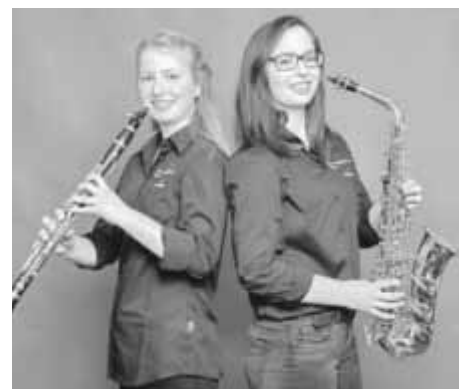
Die städtische Musikschule lädt im Dezember zu Konzerten in der Innenstadt ein.

Freitag, 07. Dezember, 18.00 Uhr, Ratssaal Samstag, 08. Dezember, 9.30 Uhr, Liebfrauenkapelle Samstag, 08. Dezember, 11.00 Uhr, Liebfrauenkapelle Samstag, 08. Dezember, 15.00 Uhr, Ratssaal