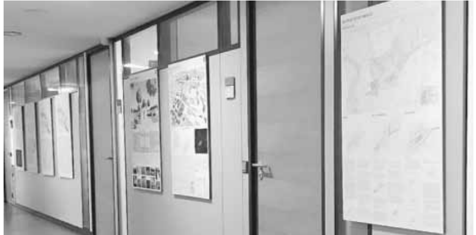
Im Flur des Bauamtes können die Pläne eingesehen werden.

Es werden vier verschiedene Plansätze zu sehen sein, die im Rahmen eines städtebaulichen Wettbewerbs von jeweils einem Planungsbüro erarbeitet wurden. Aus den vier Plänen soll derjenige ausgewählt werden, der sich in der Breite am tragfähigsten beziehungsweise am ganzheitlichsten darstellt. Die Bürger haben hierzu jeweils an den oben genannten Terminen die Möglichkeit, sich die Pläne anzusehen und ihre Meinung anhand eines Fragebogens einzubringen. Die Anregungen werden in den Findungsprozess einfließen. Während der Veranstaltungen stehen Mitarbeiter der Stadtplanung bereit, um Fragen zu beantworten. Abgesehen von den Veranstaltungen besteht ab heute über den