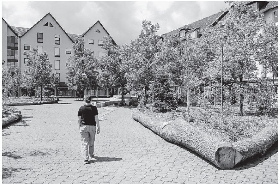
Bereits kurz nach Fertigstellung war die gewünschte Atmosphäre auf dem Berliner Platz – kühler und schattiger – zu spüren.

„Wir haben insgesamt sehr auf Nachhaltigkeit geachtet“, erklärt Zumpfe, „und haben Pflanzen verwendet, die wir übrig hatten oder günstig kaufen konnten.“ Verwendet wurden unter anderem Pflanzen aus dem Bestand des städtischen Baubetriebshofs, etwa Dahlien