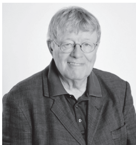
Im Mittelpunkt des Abends am 18. Juni steht der Politkrimi „Reich der Lügen“ von Hartmut Palmer.

Info: Die Lesung mit Hartmut Palmer findet am Donnerstag, 18. Juni, um 19.00 Uhr im Pop-up-Store Kultur.Gut. in der Lange Straße statt.