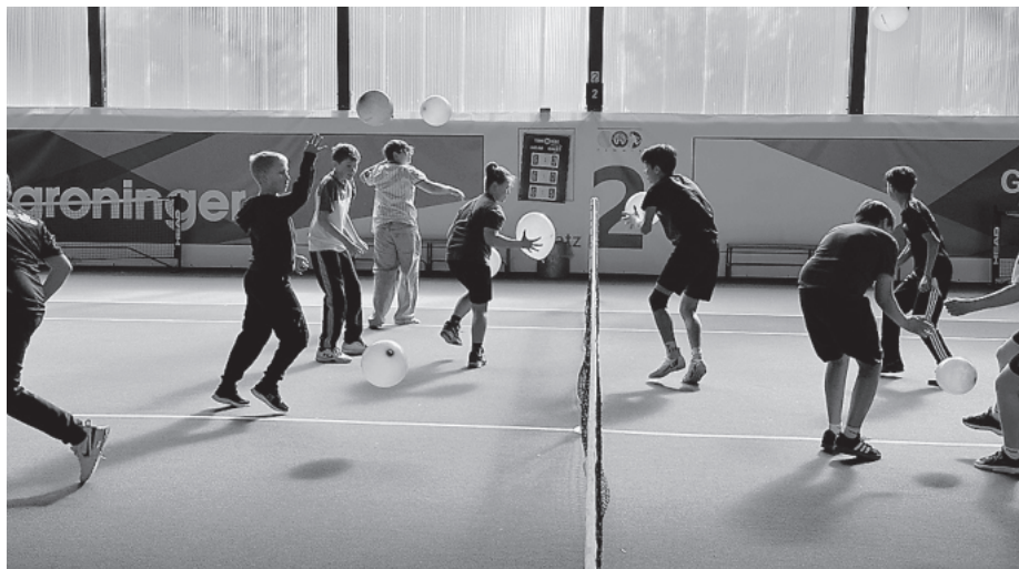
Die Nonsensolympiade bot den Schülerinnen und Schülern die Möglichkeit, außerhalb des regulären Unterrichts gemeinsam aktiv zu sein und verschiedene Freizeit- und Sportangebote kennenzulernen.

Beim Basketball trainierten die Teilnehmenden in der BlueBox der Crailsheimer Merlins. Das Bouldern führte die Schülerinnen und Schüler an die Kletterwand, wo ohne Seil in Absprunghöhe geklettert wurde. Beim Cross Golf wurde die Umgebung zum Spielfeld, während beim Flag Football die Grundlagen der kontaktlosen Variante des American Football vermittelt wurden. Die Inliner-Gruppe unternahm eine gemeinsame Tour und im Fitnessstudio LifeForce erhielten die Teilnehmenden Einblicke in verschiedene Trai-