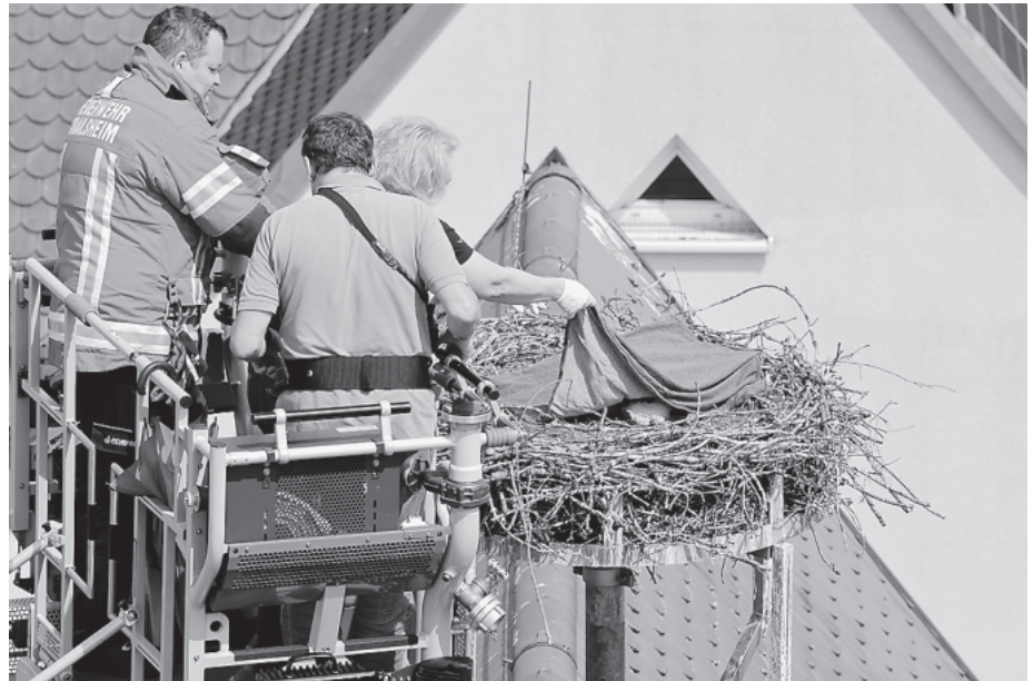
Die Störche auf dem Rathaus werden weiterhin mithilfe der Freiwilligen Feuerwehr beringt, nur nicht mehr auf privaten Gebäuden.

Dann folgten Reaktionen seitens der Verwaltung bezüglich des Schreibens der Storchenauftraggeber, das zur kurzfristigen Vertagung geführt hatte. So-