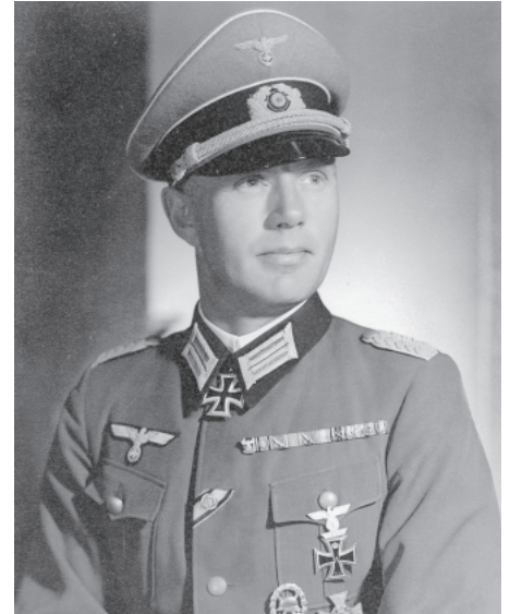
Friedrich Gustav Jaeger als Major (Aufnahme vermutlich aus dem Jahr 1936). Im Vortrag werden das Leben und Wirken des Widerstandskämpfers beleuchtet.

Info: Der Vortrag findet am Dienstag, 23. Juni, um 19.30 Uhr im Arkadenforum statt. Die Teilnahme kostet 5 Euro an der Abendkasse, Mitglieder des Crailsheimer Historischen Vereins erhalten freien Eintritt. Eine Veranstaltung des Stadtarchivs Crailsheim und des Crailsheimer Historischen Vereins.