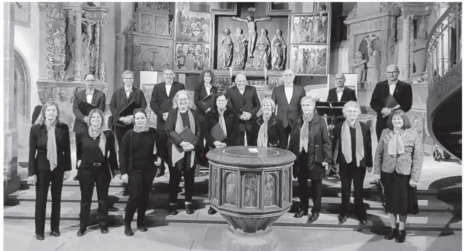
Der Kammerchor singt am Samstag, 20. Juni, in der Gottesackerkapelle über die Schönheit und den Schrecken von Nacht und Natur.

Auf der anderen Seite stehen das Dunkel und die Ruhe der Nacht – aber auch die Schrecken der Finsternis und der Einsamkeit. Der Bogen der Nachtlieder reicht von Claudius' „Der Mond ist auf-