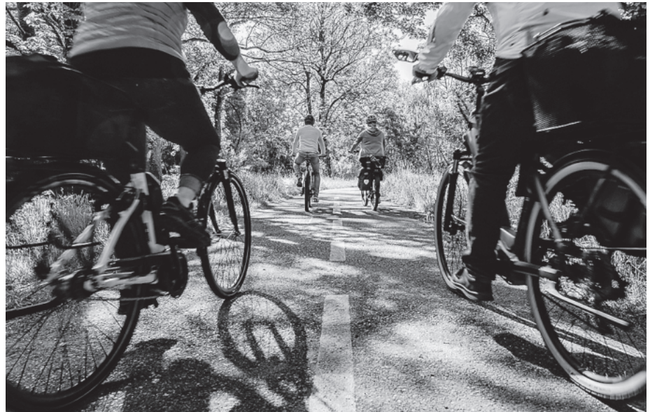
Das Stadtradeln startet am Montag, 29. Juni, mit einem gemeinsamen Auftakt- radeln mit dem TSV Crailsheim.

Dass sich die Teilnahme am Stadtradeln lohnt, zeigte bereits das vergangene