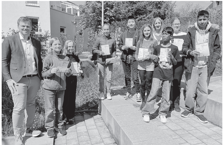
Am ASG gab es einige Schülerinnen und Schüler, die beim Känguru-Wettbewerb erfolgreich waren.

Der Känguru-Wettbewerb ist ein internationaler Mathematikwettbewerb, der jedes Jahr Millionen von Schülerinnen und Schülern weltweit dazu motiviert, Freude am Knobeln und an mathematischen Herausforderungen zu entwickeln.